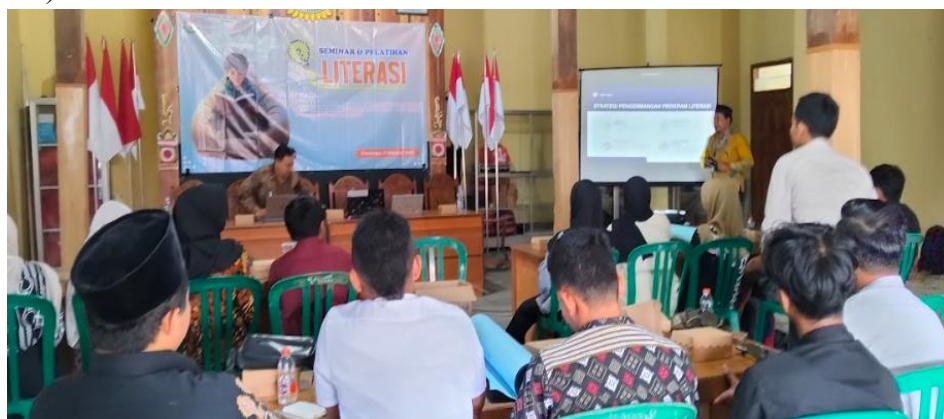
Gambar 2. Workshop pengelolaan rumah literasi

promosi; serta (d) pemanfaatan teknologi digital untuk memperluas jangkauan literasi. Setiap modul disampaikan dalam dua sesi, sesi konseptual (30 menit) dan sesi praktik terbimbing (90 menit), sehingga peserta memiliki cukup waktu untuk mengaplikasikan pengetahuan secara langsung. Pendekatan ini sejalan dengan kerangka pengembangan materi pelatihan yang dikemukakan oleh Novawan, yang menekankan pentingnya relevansi, keterpaduan, dan aplikabilitas dalam setiap komponen pembelajaran (Novawan et al., 2024).