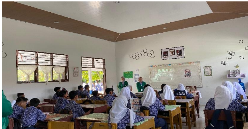
Gambar 1. Pelaksanaan sosialisasi

Pada kegiatan ini, dijelaskan pengertian, jenis-jenis beserta contohnya, dampak, serta cara mencegah tindakan bullying . Selain materi, kami juga melakukan tes pertanyaan di sela-sela sosialisasi untuk memastikan siswa tidak hanya mendengarkan, tetapi juga memahami materi yang disampaikan. Siswa juga diberikan kebebasan untuk membuat surat berisi curhatan hati tentang pengalaman mereka mendapatkan perlakuan bullying atau hal personal lainnya. Media surat anonim ini bertujuan memberikan ruang bagi siswa untuk meluapkan isi hati mereka. Di akhir kegiatan, para siswa juga diminta menyanyikan lagu "anti- bullying " untuk menumbuhkan semangat mereka dalam mencegah tindakan bullying .