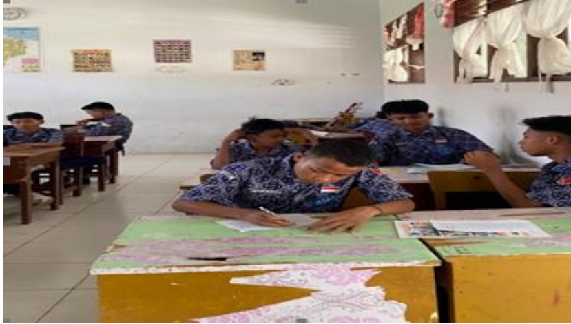
Gambar 3. Siswa mengisi surat anonim