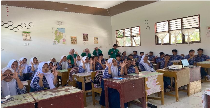
Gambar 2. Foto bersama siswa kelas XI-1