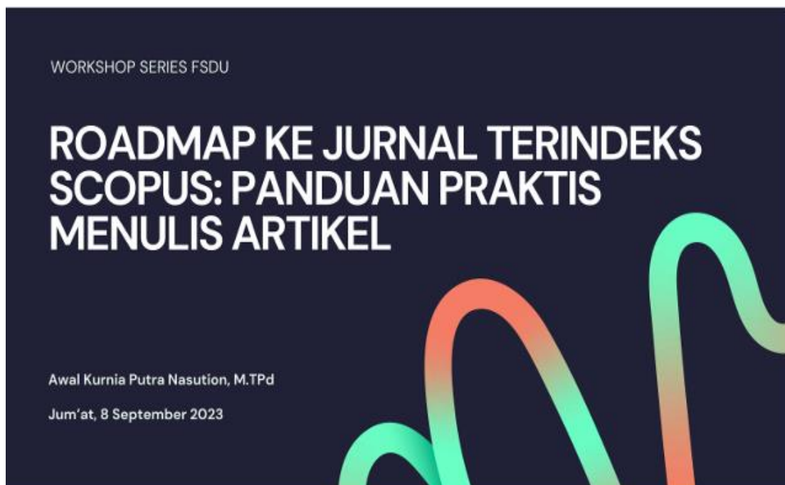
Gambar 2. Cover materi workshop