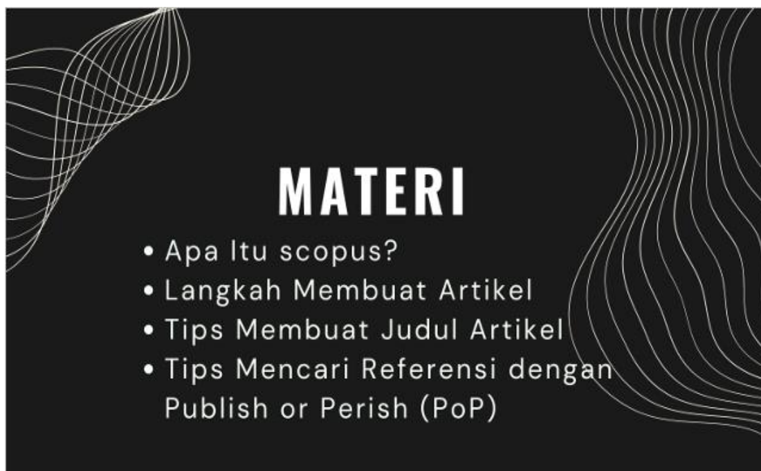
Gambar 3. Materi workshop

Perencanaan yang baik adalah langkah awal yang sangat penting dalam menjamin keberhasilan sebuah workshop. Identifikasi tujuan dan target peserta adalah langkah pertama yang tepat untuk memahami apa yang ingin dicapai dalam workshop ini dan untuk siapa itu ditujukan. Dalam hal ini, target peserta yang teridentifikasi dengan jelas adalah dosen, mahasiswa, peneliti, dan penulis potensial yang ingin meningkatkan keterampilan mereka dalam menulis artikel ilmiah yang dapat diindeks di Scopus.