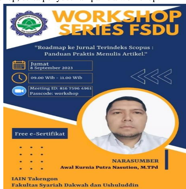
Gambar 1. Flyer Workshop

Pengorganisasian acara workshop dimulai dengan mempersiapkan link pendaftaran peserta workshop, pendaftaran peserta workshop dibuat dalam bentuk google form. Promosi acara melalui berbagai saluran seperti media sosial, grup WhatsApp dan email. Selanjutnya dilakukan persiapan fasilitas, teknologi, dan materi pelatihan yang diperlukan untuk mendukung workshop. Workshop dilaksanakan dengan menggunakan aplikasi zoom. Pengorganisasian acara juga meliputi pembuatan tata tertib acara dan susunan acara workshop, serta penyusunan panitia workshop.