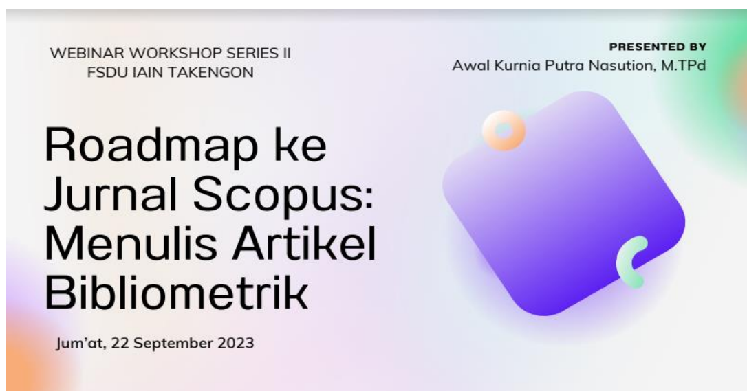
Gambar 4. Materi webinar