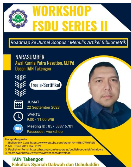
Gambar 1. Flyer workshop

Promosi acara dilakukan melalui berbagai saluran komunikasi seperti media sosial, grup WhatsApp, dan email. Pendekatan ini memastikan bahwa informasi mengenai workshop menjangkau sebanyak mungkin calon peserta. Strategi promosi yang beragam ini efektif untuk memastikan informasi tentang workshop mencapai target peserta yang tepat, sehingga meningkatkan minat dan partisipasi dalam acara tersebut.